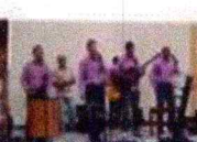
Filho da Promessa