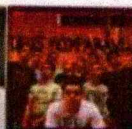
Grupo Geração Vida