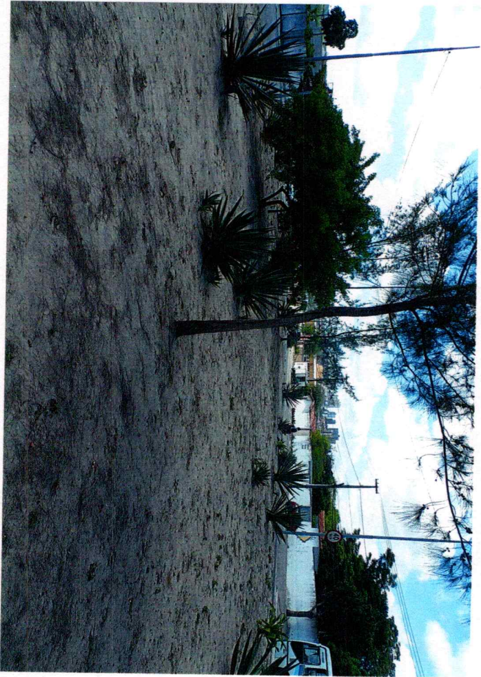
AV: MANOEL NOTO - BAIRRO BOBOCONGO