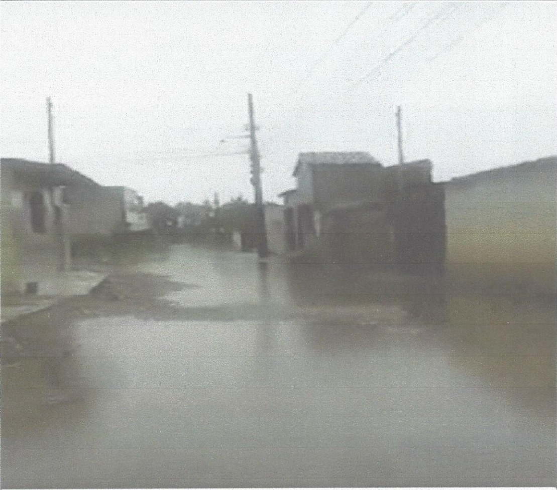
Rua Maria Venerada de Araújo - São José da Mata