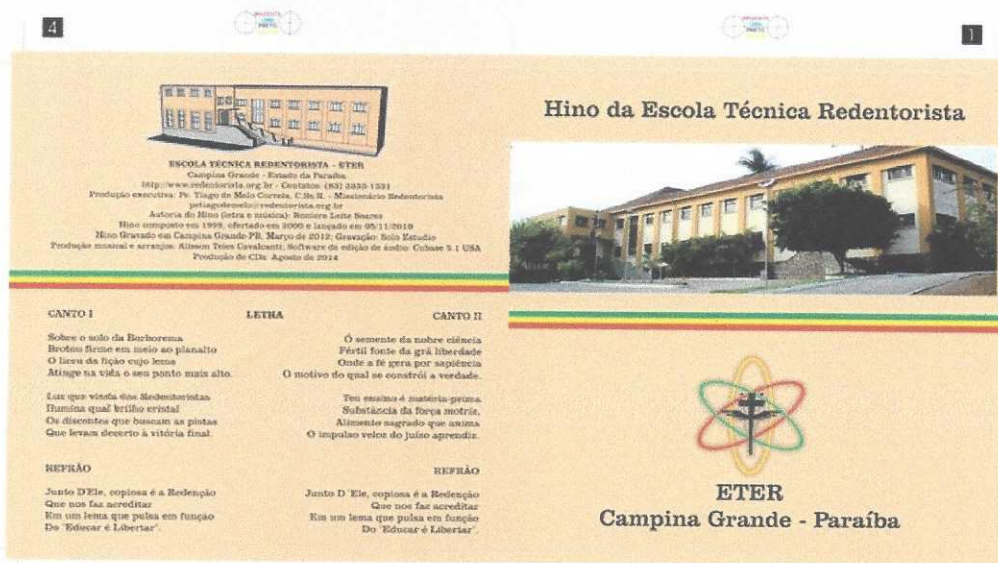
Capa do CD com o Hino da Escola Técnica Redentorista (ETER), em várias versões