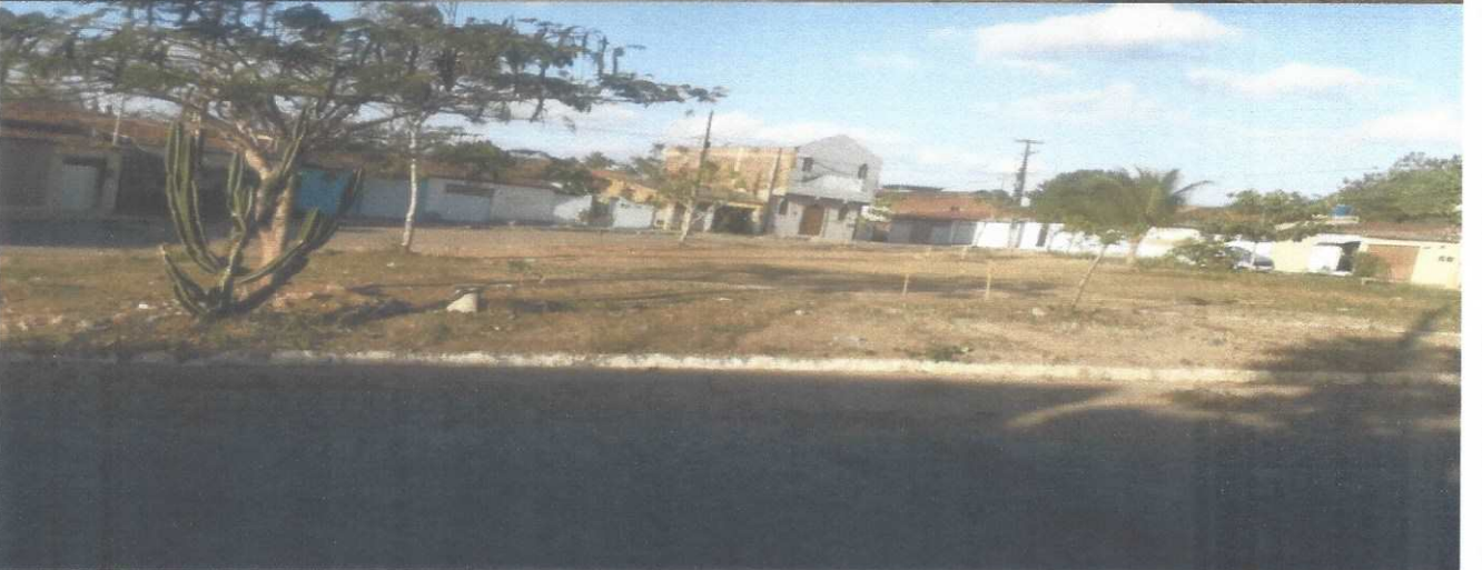
Anexo 1: local de construção da praça na Rua Judivan Cabral – bairro: velame