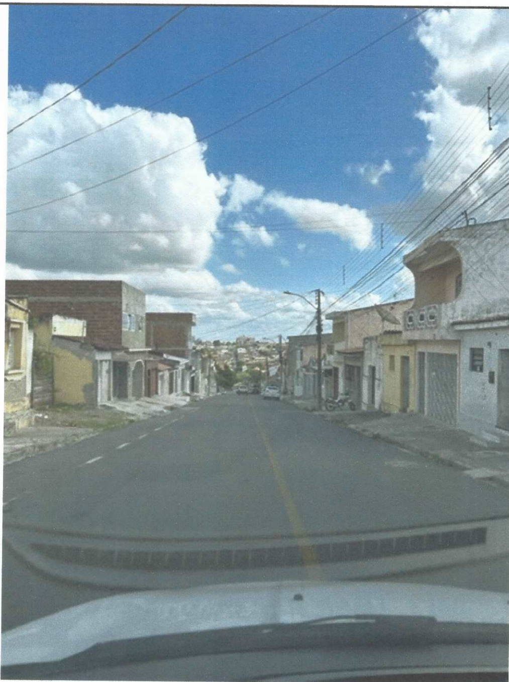
ANEXO: RUA DA REPÚBLICA (PARTE DE CIMA) SEM NENHUM INSTRUMENTO DE REDUÇÃO DE VELOCIDADE DE VEÍCULOS.