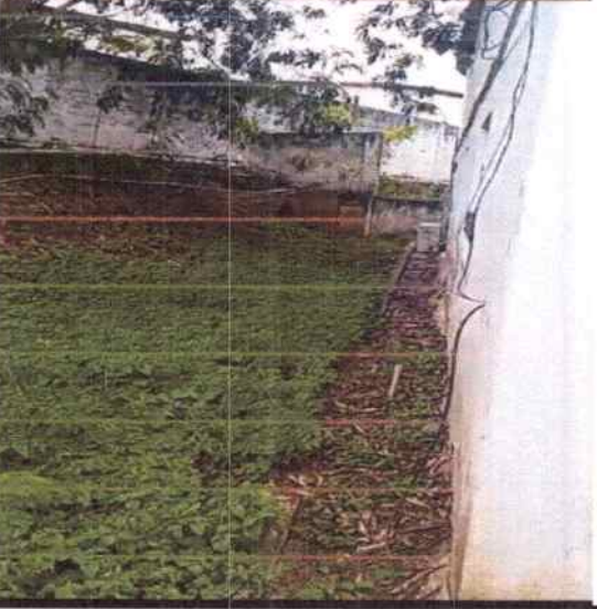
Rua Santa Clara, s/n - São José - Campina Grande - PB - CEP 58400-540