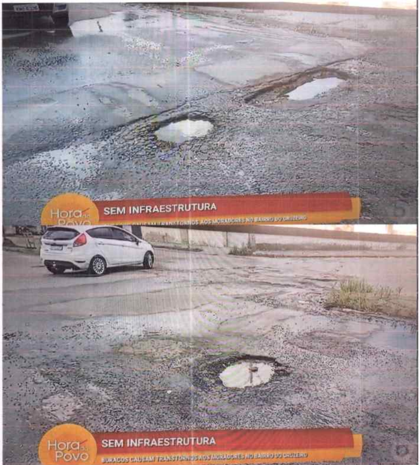
IMAGENS MERAMENTE ILUSTRATIVAS DO LOCAL