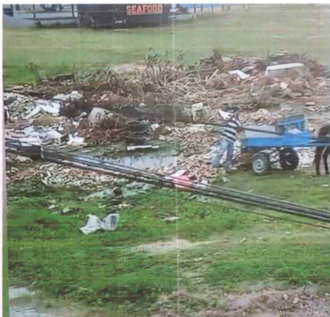
IMAGENS DO LOCAL